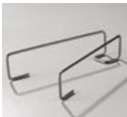
Support panier «V» Omega 219295