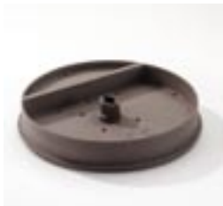
Plateau à instruments Classic 219293 Omega 229310