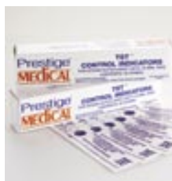
Paquet de languettes de stérilisation 219277 126°C 259277 121°C