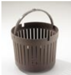
Panier à instruments standard Classic 219292