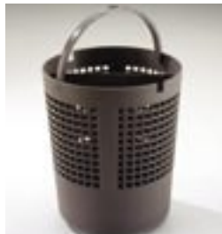
Panier à instruments 12 litres Omega 219296