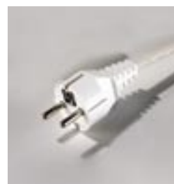
Prise Euro 219297