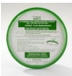
Joint de couvercle Classic 219500