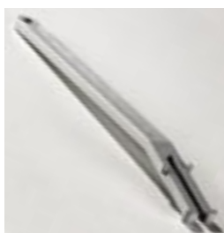
Dispositif de retrait du plateau et du support cassettes