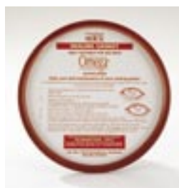
Joint de couvercle Omega 229216