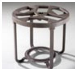
Support pour cassettes Classic 219290 Omega 249025